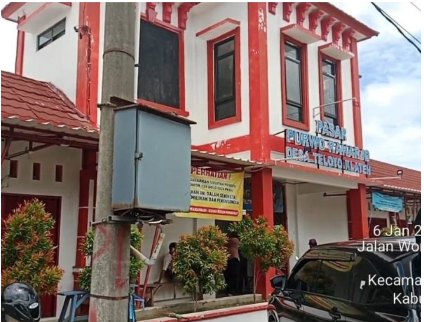
Foto: Pasar Purwo Raharjo di Desa Teloyo, Kecamatan Wonosari, Kabupaten Klaten, kembali memicu perhatian publik.

KLATEN - Polemik sengketa tanah Pasar Purwo Raharjo di Desa Teloyo, Kecamatan Wonosari, Kabupaten Klaten, kembali memicu perhatian publik.